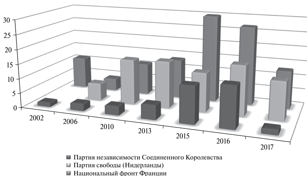
Рис.2. Снижение популярности партий крайне правого толка в Великобритании, Франции и Нидерландах, %

сторону колеблющихся избирателей 8 . В итоге, имея все шансы на победу, партия Г. Вилдерса оказалась второй, уступив правящей Народной партии.