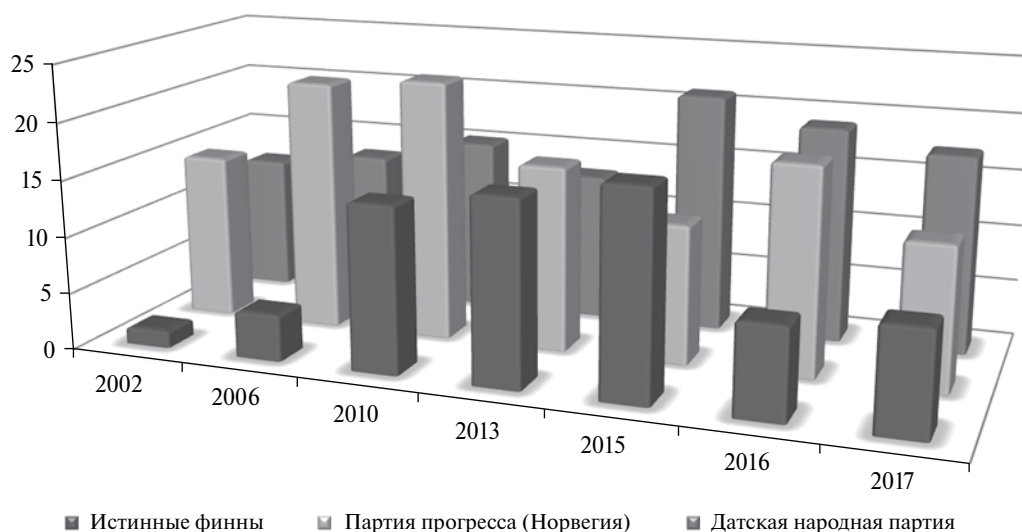
Рис. 1. Рейтинги популярности трех скандинавских ультраправых партий за последние полтора десятилетия (2002–2017 гг.), %

В 2017 г. еще одна западноевропейская ультраправая партия продемонстрировала провальные результаты на выборах. Речь идет об Истинных финнах . На муниципальных выборах финских ультраправых