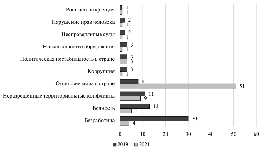
Рис. 3. Главные проблемы, стоящие перед армянским обществом, 2019, 2021 гг., %

Источник: [ист. 1, р.118; ист. 3, р. 108].