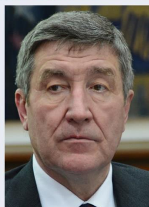
Шафраник Ю.К., председатель Совета Союза нефтегазопромышленников России; Презентация доклада