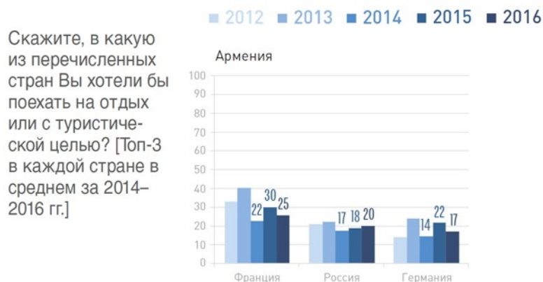
Рис.4. Привлекательные туристические направления

Россия 66 (рисунок 4). Примечательно, что в 2001–2010 гг. 26,3% опрошенных из Армении бывали в России, тогда как только 2,4% опрошенных из России бывали в Армении. 67