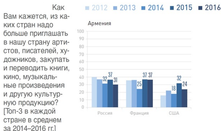
Рис.5. Интерес к культуре страны

В контексте измерения социокультурной дистанции/близости между государствами наряду с интересом к посещению другой страны не менее важным является выяснение вопроса о готовности к встрече (приему) зарубежных гостей. По данному показателю Россия является третьим желанным источником зарубежных гостей. Кстати, интерес респондентов Армении к региону СНГ по данному вопросу один из самых низких. 70