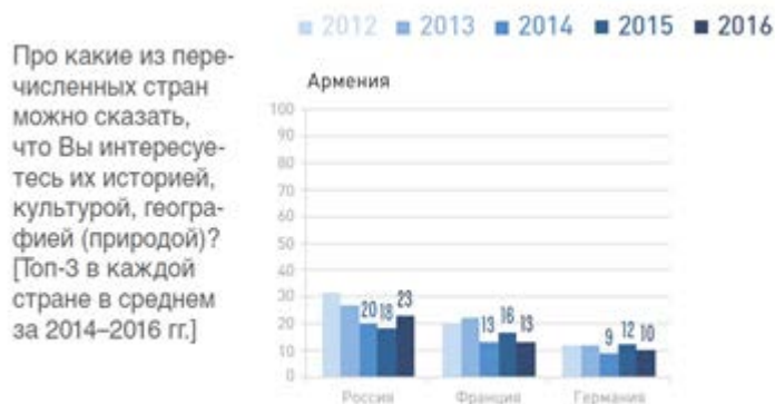
Рис.1. Интерес к стране

Одним из важных показателей социокультурной близости населения стран является наличие реальной коммуникации с родственниками, близкими, коллегами, находящимися в других государствах. В этом плане у Армении один из самых высоких показателей в пределах постсоветского пространства, поскольку 83% респондентов имеют реальную связь с родственниками, близкими, коллегами, находящимися в странах СНГ. 63 Внутри региона СНГ наиболее сильно связи с Россией выражены в Армении (81%) 64 (рисунок 2).