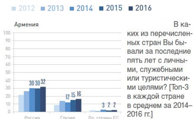
Рис.3. Визиты в зарубежные страны

Следующие два индикатора социокультурного притяжения стран – показатели реальной и потенциальной трансграничной мобильности жителей государств – характеризуют актуальные гуманитарные интересы населения и степень их реализации. Согласно этому показателю, почти каждый второй респондент Армении выезжал за пределы республики на территорию другого государства постсоветского пространства. В пределах постсоветского пространства основным объектом трансграничной мобильности является Россия. Соответственно, из Армении каждый третий выезжал в Россию, и данный показатель, с некоторым увеличением, повторяет показатели предыдущих лет 65 (рисунок 3).